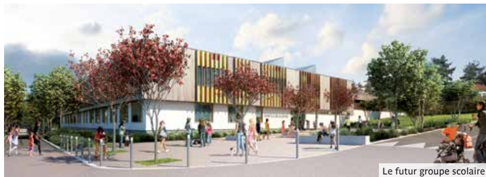
Le futur groupe scolaire