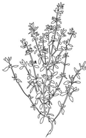
THYM COMMUN Thymus Vulgaris

Citriodorus signifiant "qui sent le citron". Il a des propriétés antiseptiques, antitussives et même cicatrisantes. Dans les jardins, il n'est pas compatible avec les cultures de concombres / cornichons / melons / courgettes / potirons. Il préfère la compagnie de tomates / choux / aubergines / pommes de terre / fraisiers.