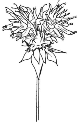
MONARDE Monarda Didyma

La monarde est une plante vivace rhizomateuse de la famille des lamiacées. Son nom "didyma" vient du grec "didumos" qui signifie jumeau en référence aux divinités grecques Appolon et Artemis.