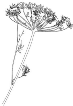
ANETH Anethum Graveolens

On lui prête de nombreux noms : agastache fenouil, anis hysope, hysope anisée ou grande hysope. Les insectes pollinisateurs sont friands de son pollen et les abeilles donnent ainsi un miel au léger goût d'anis. Une huile essentielle d'agastache est extraite, elle est utilisée en parfumerie et dans l'industrie alimentaire. Au jardin, elle aurait le pouvoir d'éloigner les moustiques et certains ravageurs du chou. Du fait de sa longue période de floraison elle est un atout pour tous les insectes pollinisateurs et la biodiversité.