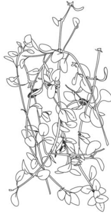
THYM CITRON Thymus X Citriodorus

Son nom thymus vient du grec "thymos" ou "thumos" et aurait pour origine le mot égyptien "tham" nom donné à une plante servant à l'embaumement des corps.