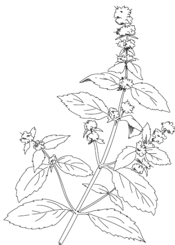
MENTHE CHOCOLAT Mentha X Piperata Chocolate

Cette menthe, de la catégorie des menthes poivrées, n'a pas une senteur chocolatée mais un parfum rappelant le fourrage d'une célèbre confiserie anglaise "after-eight".