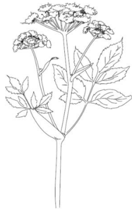
ANGELIQUE OFFICINALE Angelica Archangelica

Appelée "herbe aux anges" cette géante passait en effet pour conjurer les envoûtements et les sorciers ne résistaient pas à son odeur.