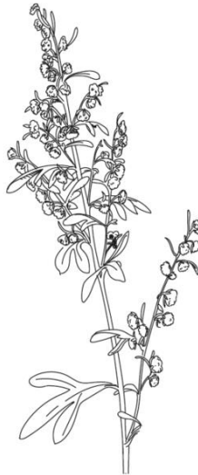
ABSINTHE COMMUNE Artemisia Absinthium

On lui prête d'autres noms tels que : armoise amère, herbe sainte, aluynie ou encore herbe aux vers. On nomme les fruits "akène".