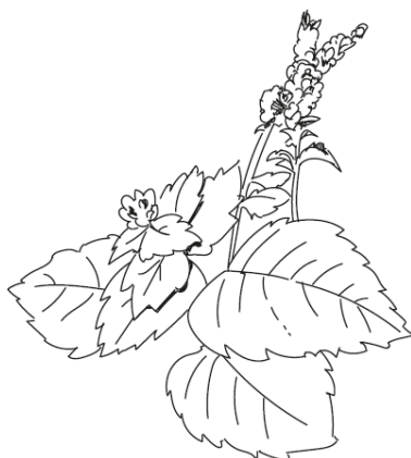
MENTHE VERTE Mentha Spicata

Elle est idéale à installer au potager car elle éloigne de nombreux insectes indésirables comme les pucerons et même certains rongeurs. Astuce pour une nuit sans moustiques...quelques gouttes d'huile essentielle de menthe et de géranium "rosat" sur un mouchoir posé près de l'oreiller. Dans le langage des fleurs la menthe représente la mémoire