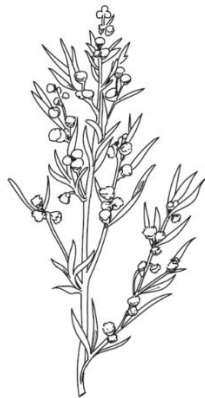
AURONE Artemisia Abrotanum

A la renaissance on la surnommait "racine du Saint-Esprit". On l'utilisait contre la peste, la rage, les morsures de serpents, la fièvre et pour diverses applications. Actuellement les pétioles et les tiges sont utilisés en confiseries ou en pâtisserie. Afin de la distinguer de la redoutable ciguë, il suffit de froisser quelques feuilles : celles de l'angélique dégageront un suave parfum alors que la ciguë empeste. Dans le langage des fleurs l'angélique évoque l'inspiration.