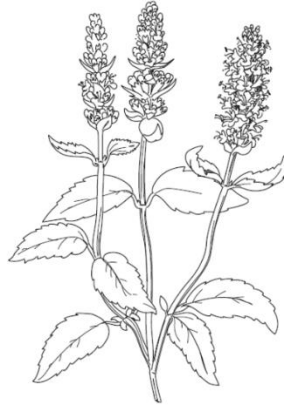
AGASTACHE FENOUIL Agastache Foeniculum

L'agastache est une plante vivace de la famille des lamiacées. Agastache vient du grec "agatos" qui signifie admirable, foeniculum étant le nom latin du fenouil.